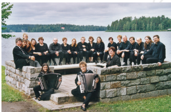
2002 - Ikaalinen (Finlande)