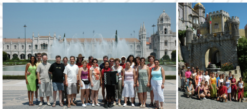
2005 - Lisbonne (Portugal)