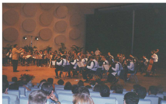
1993 - PMC Strasbourg