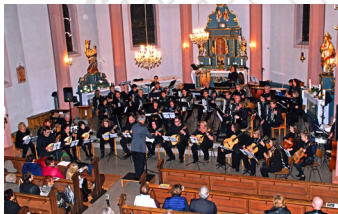
2017 - Friedrichweiler (Allemagne)