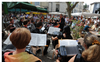
2010 - Uzès (France)