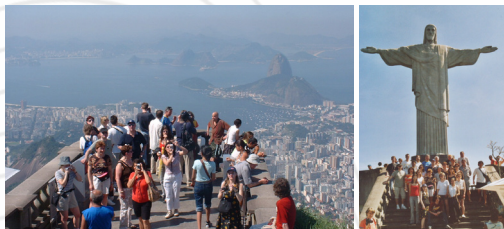
2004 - Rio de Janeiro (Brésil) 9 concerts