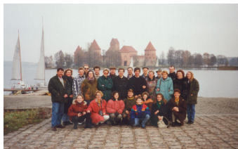
1994 - Vilnius (Lituanie)