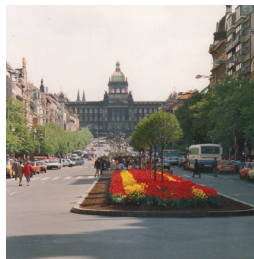
1990 - Prague (République Tchèque)