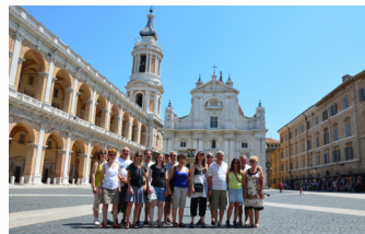
2013 - Castelfidardo (Italie)