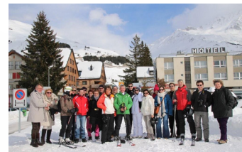
2014 - Andermatt (Suisse)