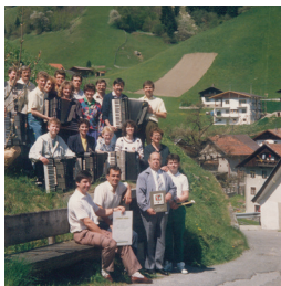
1989 - 1992 Innsbruck (Autriche)