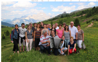
2014 - Dolomites (Italie)