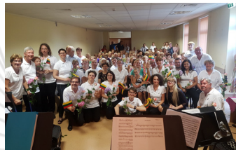
2018 - Palanga (Lituanie)