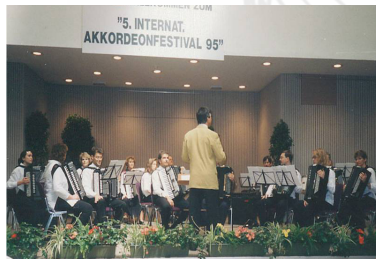
1995 - Innsbruck (Autriche) Concours international