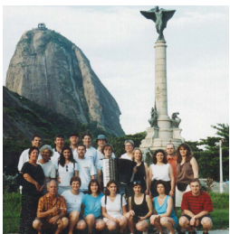
1999 - Rio de Janeiro (Brésil) 7 Concerts